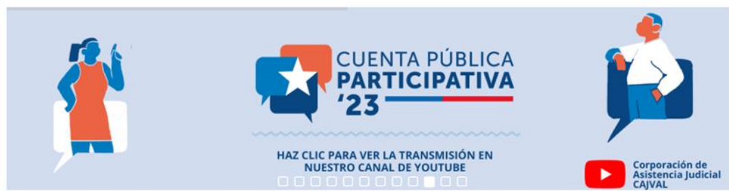
Banner sitio web CPP.

Desde el año 2023 se utilizó banner en sitio web de la CPP a modo de facilitar información de la misma a ciudadanos y ciudadanas que aporten en el proceso. Lo anterior, atendiendo al espíritu de la ley 20.500, en donde el Estado reconoce a las personas el derecho de participar en sus políticas, planes, programas y acciones, disponiendo asimismo que cada órgano de la Administración del Estado deberá establecer las modalidades de participación que tendrán las personas y organizaciones en el ámbito de su competencia.